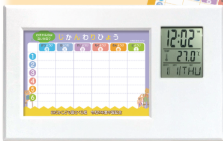
記録セット (時間割表A・ 時間割表B・ 成長の記録)