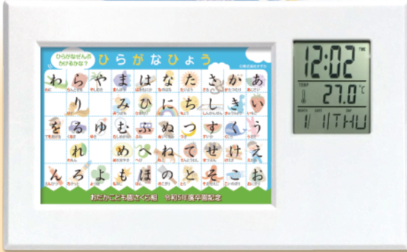
国語セット (ひらがな表・漢字表・カタカナ表)