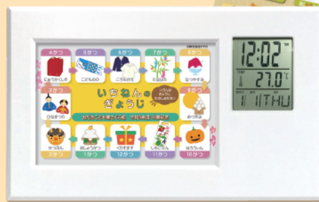
ものしりセット (一年の行事・ 干支の順番・ 太陽系の惑星)