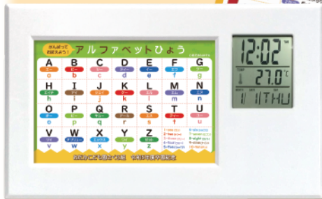
英語セット (アルファベット表・ 英語の月・ 英語の色)